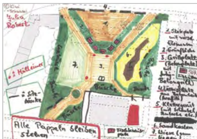
Ideenworkshop mit Jugendlichen zur Gestaltung des ehemaligen Grundschulgeländes Hauptstraße 8