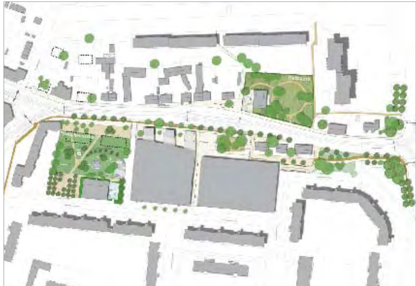
Maßnahmenkatalog und Grobkostenschätzung/Finanzierung