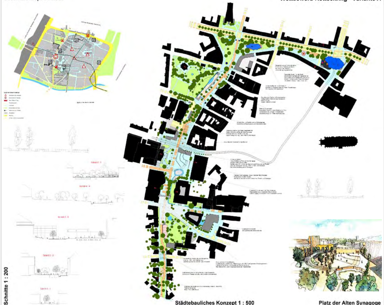
Schnitte 1 : 200